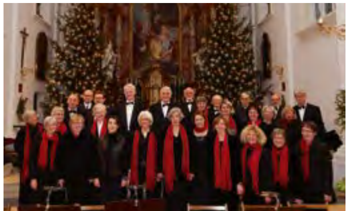
In festlichem Rahmen – der Kirchenchor St. Joseph