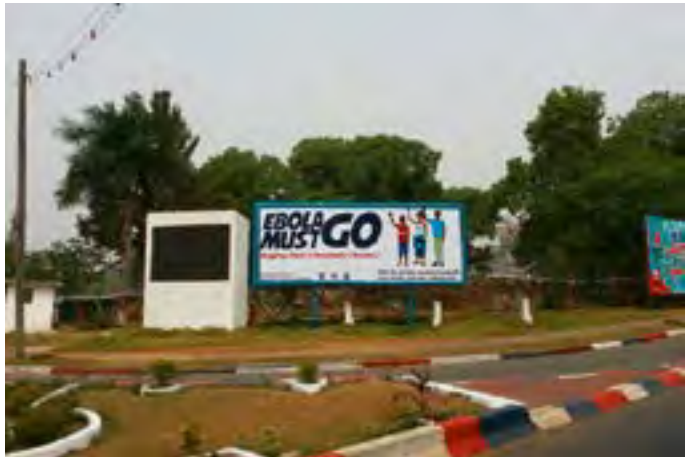
Motivationsplakat in Liberias Hauptstadt Monrovia

Mitte 2014 schaut die Welt nach Westafrika. Hier wütet das Ebola-Virus. Es tötet tausende Menschen und verstopft unsere Nachrichten mit schrecklichen Bildern. Die betroffenen Staaten bitten um Hilfe.