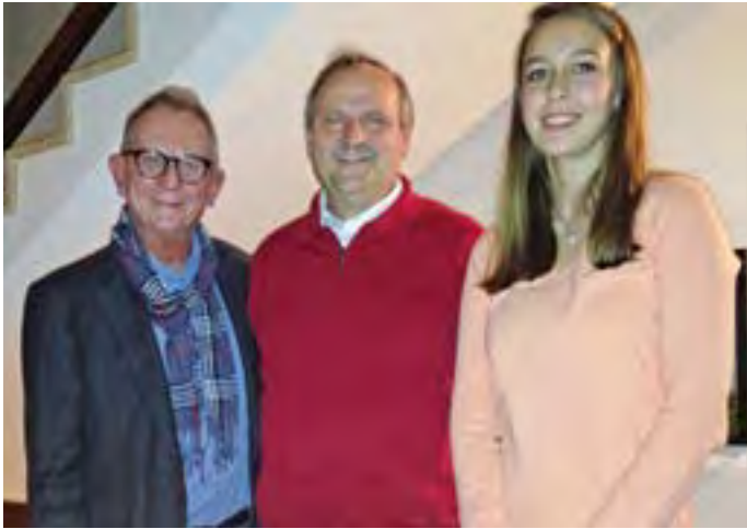
Generallinie der Ortspolitik: Lebenswert für alle Generationen

Wir wollen den Ort für diese Menschen attraktiver gestalten, zum Beispiel durch die Möglichkeit, mit öffentlichen Verkehrsmitteln unterwegs zu sein. Mit der Kirche haben wir sehr stark zusammengearbeitet, um das Quinthus nutzen zu können, in dem auch eine größere Station der Ambulanten Krankenpflege entstehen soll. Und genauso wie wir Kindergärten bauen müssen, konzentrieren wir uns auf das Entstehen weiterer Möglichkeiten für ein betreutes Wohnen im Ortsteil Traubing. Außerdem fördern wir sehr stark die Arbeit des Hospizes.