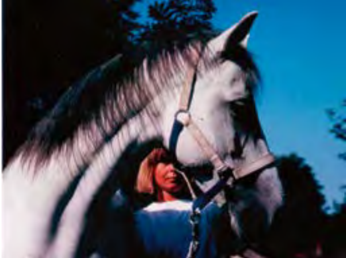
Das Tier – ein Geschöpf der Natur

Fiffi, Miezi, Fury aber auch Meister Lampe, Hamster Krümel, Meerschweinchen Puschel, Schildkröte Kassiopeia oder auch der Fisch Nemo sind nicht wirklich fit, fühlen sich unwohl. Allergien plagen das Tier, das (Fr)Essen schmeckt oder bekommt nicht, der treue vierbeinige Weggefährte kommt „in die Jahre“. Was ist zu tun, wer kann helfen?