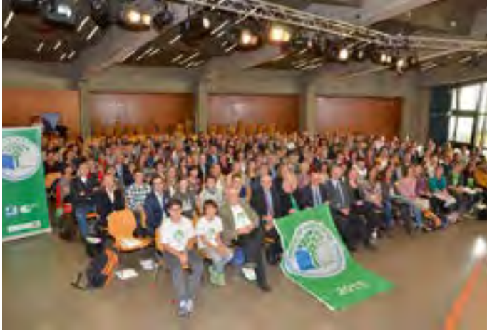
Festakt zur Verleihung des Schulpreises

„Umweltschule in Europa – Internationale Agenda 21-Schule“ ist eine Auszeichnung, um die sich bayerische Schulen bewerben können. Sie müssen dazu innerhalb eines Schuljahres zwei Themenfelder aus den Bereichen Umwelt und Nachhaltigkeit bearbeiten, dokumentieren und einer Fachjury vorlegen.