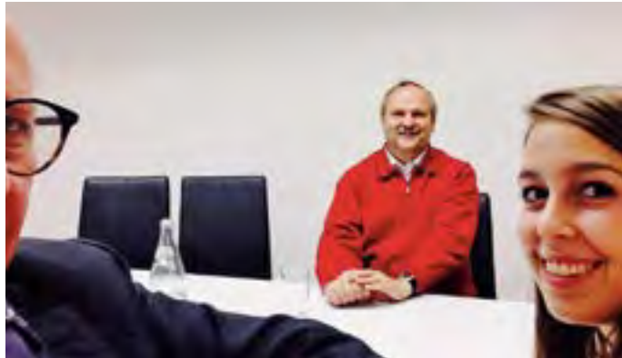
Selfie-Interviewfoto mit dem Bürgermeister: „Keine halben Sachen“

Man muss aber unterscheiden: Es kommen viele Leute her, die am Ende ihres Berufslebens stehen, die sich hier eine ruhige Ecke suchen und nicht in den Ort einbringen, aber das Rathaus mit ihren Bauanträgen gut beschäftigen. Andererseits schaffen wir durch das Anwerben von Industrie auch neue Arbeitsplätze, die Menschen in ihrem Lebensmittelpunkt, also auch mit ihren Familien, hierher bringen, die eine Bereicherung des Gemeindelebens darstellen.