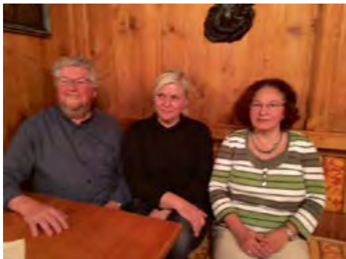
Vorstand der Initiative MitWohnen

Die Gemeinschaft hat sich die Aufgabe gestellt, den Bürgern im Landkreis Starnberg Mitwohnen und Wohnen gegen Hilfe näher zu bringen. In Tutzing, wie auch am ganzen Westufer des Starnberger Sees besteht akute Wohnungsnot. Gesucht werden vor allem kleine und preiswerte Wohnungen. Teilweise werden auch Wohngemeinschaften angestrebt.