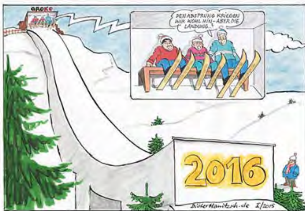
Das Risiko und die Chance vor dem Absprung in die kommenden 365 Tage des Schaltjahres

Tutzing ist so ein Mehr-Generationenort, in dem das Miteinander zwischen Jung und Alt sichtbar und erlebbar ist, manchmal auch konkurrierend in den Prioritäten ortspolitischer Vorhaben – vom Einheimischen-Modell für die Schaffung neuen Wohnraums, über Kinderhäuser, Begegnungstätten für die Jugend bis hin zu Medizin- und Pflegeeinrichtungen. Das Netz dafür soll auch 2016 dichter geknüpft werden, zeigen die Beiträge in diesem ersten Heft des Jahres. Dazu gehört nicht nur kluge Planung und Zusammenhalt, sondern auch Fortüne: Also noch einmal: „Ein gut's Neues!“ HKM