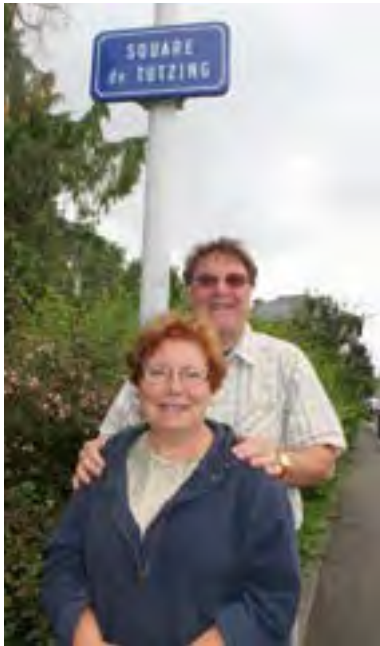
Auf Stippvisite in der französischen Partnerstadt

40 Jahre Partnerschaft zwischen den Gemeinden Bagnères-de-Bigorre in Südfrankreich und Tutzing – das war ein Grund für 25 Tutzinger Künstler(innen), eine gemeinsame Ausstellung im Tutzinger Rathaus unter dem Titel „Rendezvous – Kunst verbindet“ zu gestalten. Dazu gelang es, auch zwei Maler(innen) aus Bagnères des Bigorre zur Teilnahme zu verpflichten.