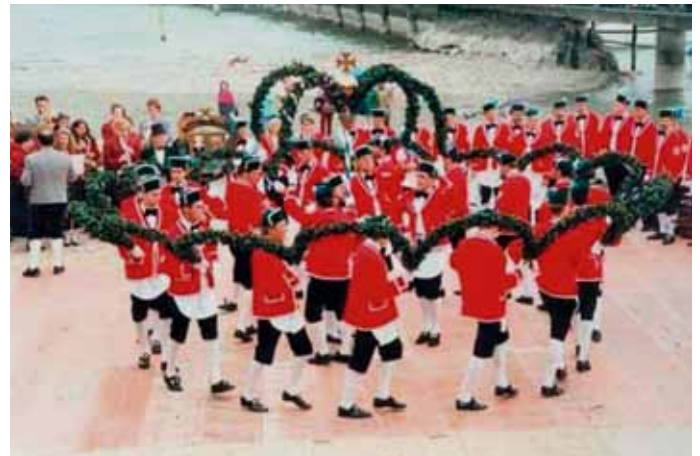
Schäfflertanz: Alle sieben Jahre ein Höhepunkt

2012 ist Schäfflertanz-Jahr. Alle sieben Jahre ist es soweit: Die Schäffler lassen eine alte Tradition wieder aufleben, die auf das Jahr 1517 zurückgeht. Heuer können die Tutzinger vor Ort in den Genuss eines ihrer Auftritte kommen: In