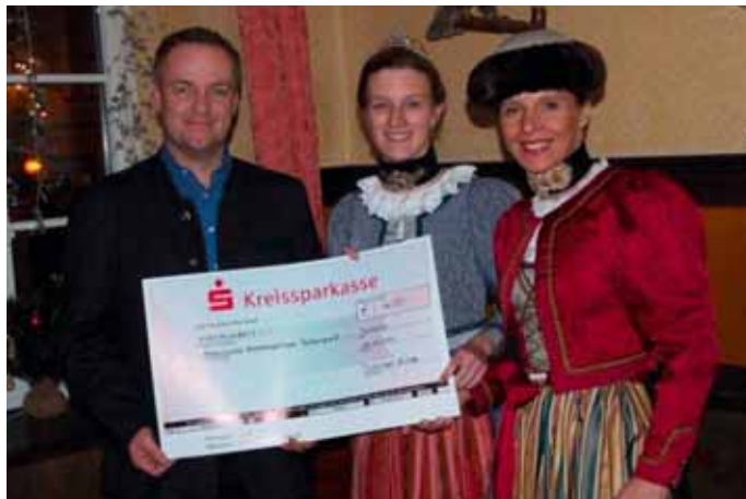
Scheck für Trachtentradition

Dank der vielen fleißigen Hände ihrer Mitglieder verkaufte die Tutzinger Gilde auf dem Christkindlmarkt hausgemachte Plätzchen, fruchtige Marmeladen, liebevoll handgemachte Präsente und einige Raritäten aus dem Gilde Fundus. Schon weit vor der Adventszeit wurde mit den Vorbereitungen begonnen und zum traditionellen Tutzinger Christkindlmarkt angeboten. Aus diesen Einnahmen entstand ein Gesamterlös von 800 Euro.