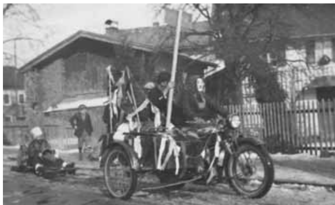
Faschingsumzug in den 30er Jahren