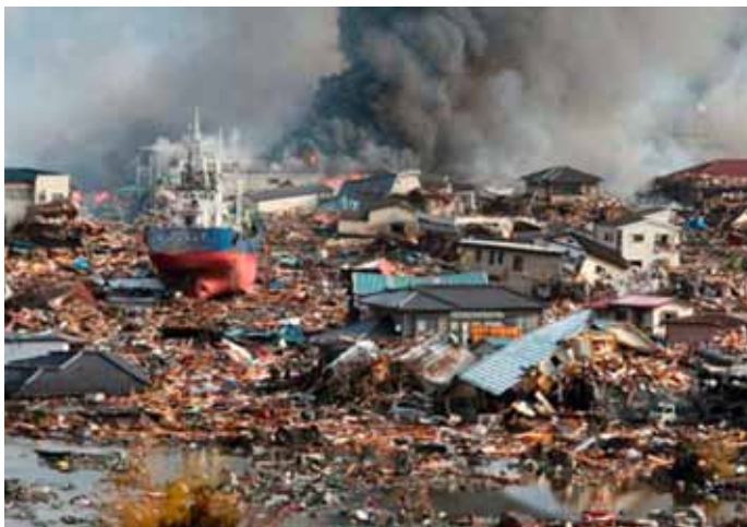
Naturgefahren: Verheerungen an Japans Küste

lichen Schäden (ohne die Kosten des Nuklearunfalls in Fukushima!) hat das Jahr 2011 eine neue Rekordmarke gesetzt. Die Katastrophenstatistik belegt – auch nach Bereinigung für Inflation und zunehmende Beobachtungsdichte - einen klaren Trend zu steigenden Schäden aus Naturkatastrophen. Ursache dafür sind die Zunahme der Weltbevölkerung, begleitet von Urbanisierung, steigendem Wohlstand und der Ballung von Werten in häufig hochgefährdeten Küstenräumen und Talbecken. Die Trefferwahrscheinlichkeit für Naturereignisse wird durch diese Faktoren dramatisch erhöht und - global gesehen - nicht durch einen entsprechend verbesserten Schutzstandard wettgemacht. Zusätzlich wird ein Einfluss der globalen Erwärmung auf die Zunahme extremer Wetterereignisse immer augenscheinlicher.