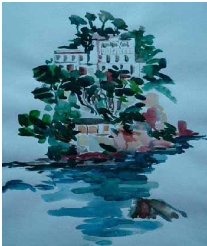
Impressionen in Farbe von Gesine Wessels

Die Textil- und Modedesignerin Gesine Wessels ist den Damen in Tutzing durch ihre Kreationen in edlen Materialien bekannt, die sie in ihrem Atelier im TGZ entwirft.