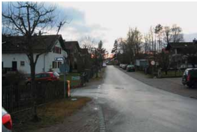
Kampberg heute: Aufschwung durch Gewerbeansiedlung

kam es im Juli 2011 zum Abschluss. Ein großzügiges Verwaltungsgebäude mit Bürofläche und Mitarbeiterparkplätzen ist geplant. Die Fa. W.A.F. ist ein Institut für Fortbildung und als unabhängiger Seminarplaner ausschließlich für die Fortbildung von Betriebsräten spezialisiert. Es handelt sich hierbei um einen immissionsarmen Gewerbebetrieb mit wenig Lieferverkehr und er wird damit dem Ort Kampberg gut zu Gesicht stehen. Mit der Ansiedlung der Fa. W.A.F. soll nun die Wirtschaftskraft in Tutzing deutlich belebt werden.