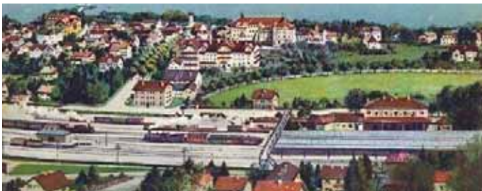
An der Bräuhausstraße: Planiert für neue Wohnungen und Allee in den 20er Jahren