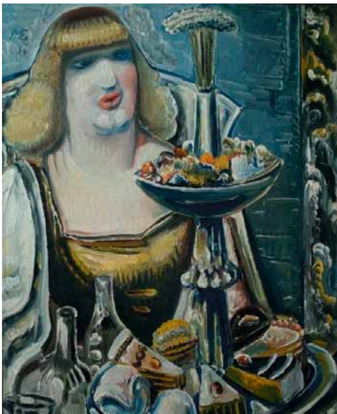
Opulente Motive: „Frau mit Konfekt“ auf Öl/Holz (1936)