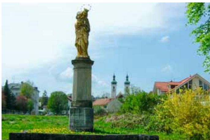
Jubiläumsfeier im Marienmonat Mai 2012