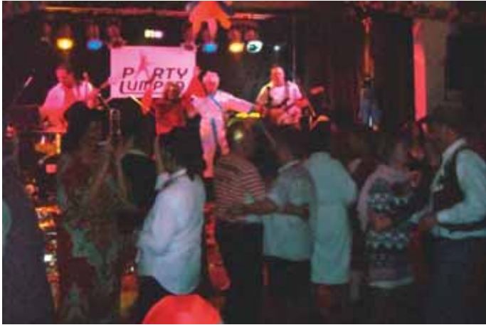
Lumpenparty als närrischer Höhepunkt

Auf geht's zum Traubinger Fasching. Die Traubinger Gemeinschaft e.V., die Dachorganisation der Traubinger Vereine, hat wieder zahlreiche närrische Höhepunkte organisiert. Am Samstag 11.02.12 um 20:00 Uhr, steigt der „Ball der Vereine“ im Festsaal des Gasthauses Buttlerhof (Buttlerweg 6) mit der Oktoberfestband „Partylumpen“ und einer trendigen Themenbar im Foyer. Mit der Eintrittskarte für 9,00 Euro nehmen Sie gleichzeitig an einer Verlosung teil. (Vorverkauf im Gasthaus Buttlerhof, Tel. 08157-926666).