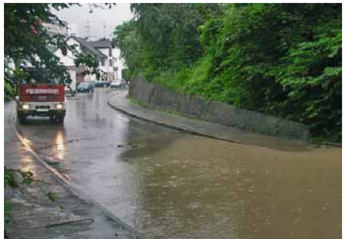
Nasse Sommer mit Überschwemmungen hierzulande

Nicht gewinnorientierte Unternehmen wie GeoHazards International oder BuildChange oder die nepalesische Gesellschaft für Erdbeben-technologie (NSET) bewirken mit ihren Präventionsprojekten viel Gutes in der Dritten Welt. Ungleich mehr ließe sich aber in globalem Rahmen erreichen, wenn selbst nur ein Bruchteil der Milliardenbeträge an privaten und öffentlichen Spenden- und Hilfsgeldern, die in unmittelbare Katastrophenbewältigung fließen, für Programme zur Schadenprävention bereitgestellt würde.