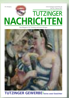
Titelbild: „Der Maler und seine Frau im Faschingskostüm“ von Paul Kleinschmidt (1940, Öl/Lwd. 128x88cm, Beitrag Seite 22.

Anzeigenschluss: 16. Februar 2012, Erscheinungstermin: 28. Februar 2012.