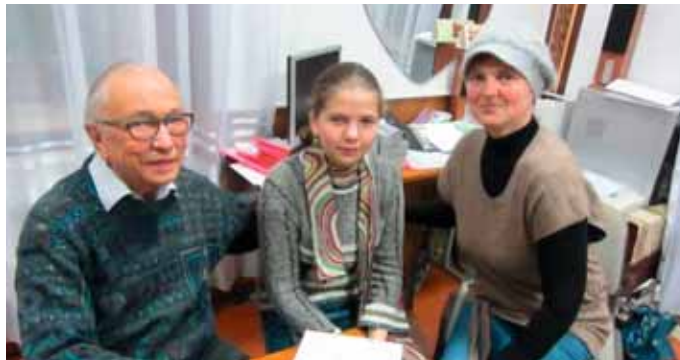
...zu neuen Lebenschancen

Insgesamt passten wir in drei Tagen ca. 45 Hörgeräte an. Zuerst an Kinder, die neu in der Internatsschule sind, aber auch an Schüler, deren Hörverstärker defekt waren oder verloren gingen. Unter den neu versorgten Kindern waren auch zwei zehnjährige, schwerhörige Zwillingmädchen. Die