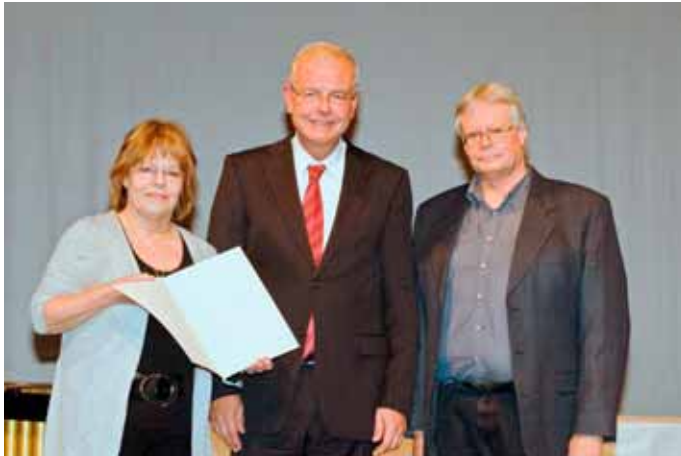
Die Preisträger und der Staatssekretär (Mitte)

Das KurTheater Tutzing erhielt Anfang Dezember als eines von insgesamt 60 ausgezeichneten bayerischen Kinos vom FilmFernsehFonds Bayern, den Kino-Programm-Preis 2011 für sein qualitativ herausragendes Jahresfilmprogramm