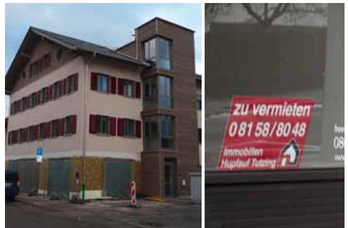
Die Lage in der Ortsmitte verändert sich

dem Bau von Verkaufsflächen im Lindemann-Südbau sowie im neuen TGZ Areal wird sich die Situation geschäftlich in der Ortsmitte weiter verschlechtern. Eine auswärtige Immobilienfirma verschickte bereits Angebote an Ladenbesitzer, Geschäftsräume im Tengelmann -Einkaufszentrum zu mieten. In vergleichbaren Orten, in deren Mitte ebenfalls Geschäfte durch Bau von Einkaufszentren am Stadtrand schließen, überlegt man sich, diesen Mietzuschüsse zu bieten, damit sie bleiben.