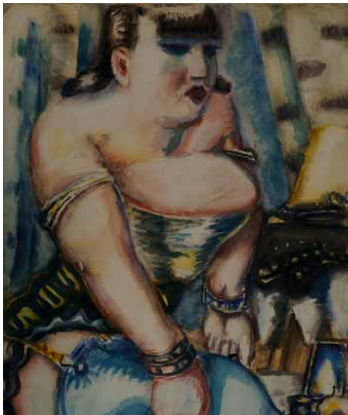
„Frau mit blauen Strümpfen“, Kleinschmidt 1942