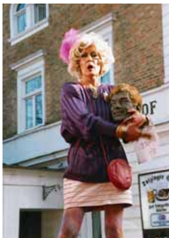
Männermordende Diva (Steckbrief noch immer aktuell)