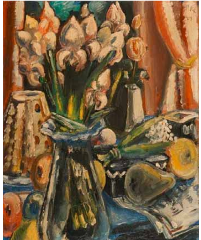
Stilleben mit Irisstraub (1948)