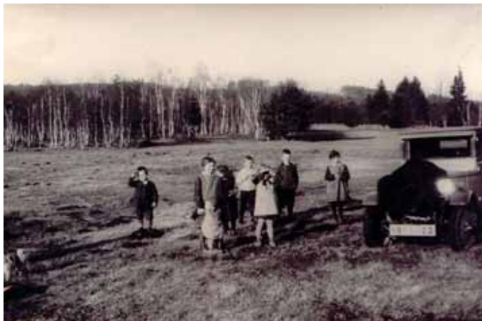
Kampberg früher: ein hartes Brot

Schön wäre es, könnte diese Vision wahr werden. Vielleicht hätte das stattgefunden, wenn seinerzeit die Fa. Boehringer hier ihren neuen Standort gefunden hätte. Aber der politische Wille war nicht vorhanden und so musste man das seit 1946 in Tutzing ansässige Biochemieunternehmen schweren Herzens ziehen lassen. Seitdem sind die Gemeindegassen klamm. Aber das soll sich bald ändern, denn ein neuer Steuerzahler, wenn auch nicht in der Größe wie einst Boehringer, will sich nun in Kampberg ansiedeln.