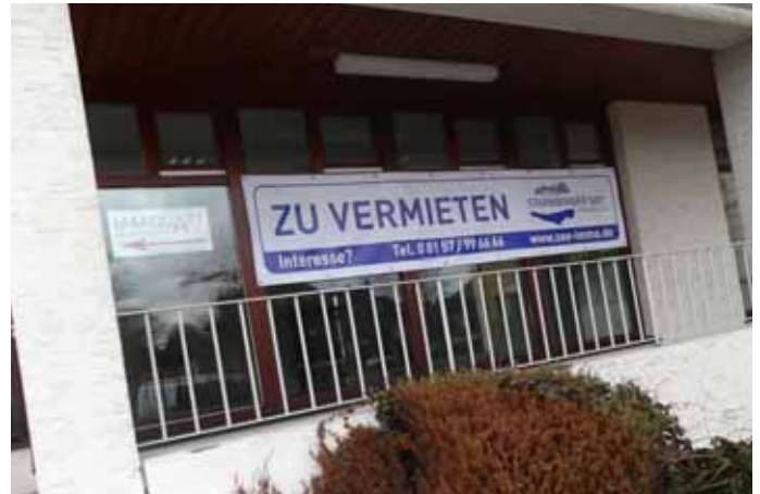
Rückgang und Umstrukturierung

Bereits heute stehen mehrere Läden leer, die derzeit nicht mehr zu vermieten sind. In Wohnungen lassen sich Geschäftsräume meist nicht umwandeln. Die Hauptstraße hat sich bereits zu einer „Fressmeile“ entwickelt, was ein nicht besonderes attraktives Erscheinungsbild abgibt. Ob hier eine Steigerung noch möglich ist, entscheiden die Bürger. Die Hoffnung, dass sich im ehemaligen Stöckerl - Haus wieder eine Metzgerei zur Belebung der Kundenfrequenz im Ort ansiedelt, hat sich leider nicht erfüllt. Mehrfach wurde auch der Hinweis gegeben, dass es in Tutzing keinen Schuhladen, vor allem keinen Schuster mehr gibt. Hier stellen wir die Frage an unsere Leser: Welche Geschäfte und Dienstleister, die eine Chance auf dem Markt haben, vermissen Sie? Würden Sie diese dann auch durch Ihr Einkaufsverhalten unterstützen? Schreiben Sie bitte dazu einen Leserbrief, oder teilen Ihre Meinung der Redaktion mit. Mit einer weiteren Belegung von Ladenflächen im Tengelmann-Zentrum und