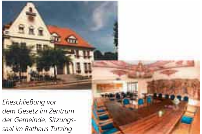
Eheschließung vor dem Gesetz im Zentrum der Gemeinde, Sitzungssaal im Rathaus Tutzing

Im Rathaus Tutzing finden Trauungen im Sitzungssaal des 1. Obergeschosses statt. Umrahmt vom thematisch passenden Wandgemälde des Kunstmalers Karl Gries mit der „Tutzinger Fischerhochzeit“ und dessen kunstvoller Deckenbemalung