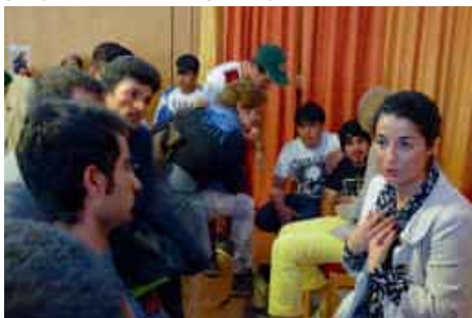
Vortragende mit Übersetzern und interessierten Zuhörern