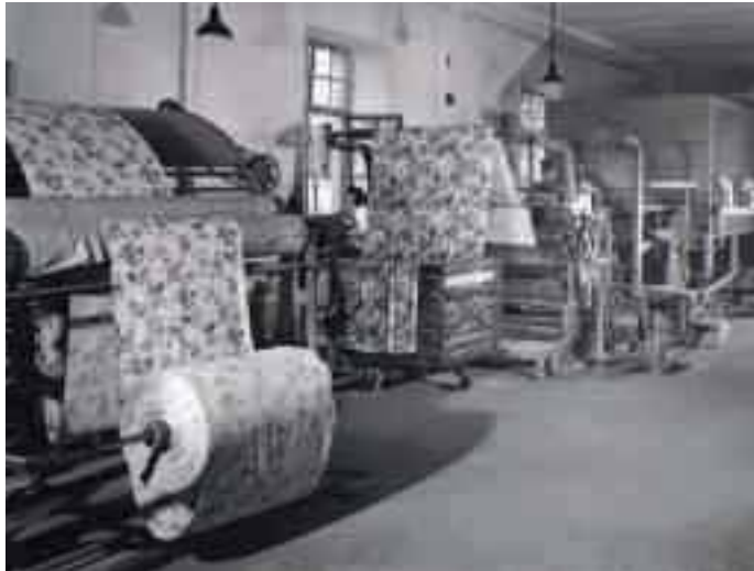
Stoff aus Tutzing in alle Welt