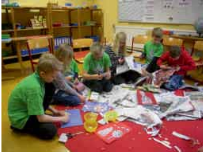
Kreativ mit Sprache umgehen- die Wortexperten in Traubing

Einen spannenden Vormittag erlebten sämtliche Traubinger Grundschüler im März: ihre Klassenzimmer wurden zum Filmstudio, zum Kunstatelier und zum Musikclub. Der Rotary Club Tutzing hat die Schüler zu diesem „starken Vormittag für Wortexperten“ eingeladen.