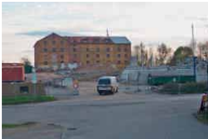
Das ehemalige Sudhaus heute renoviert und zu Wohnungen umgebaut

Vor 500 Jahren wurde das Reinheitsgebot für das Brauen von Bier verabschiedet. Aber erst um 1805 erhielten die Brauereien auf dem Lande das Recht, ebenso viel Bier zu brauen und es auszuliefern wie ihre Kollegen in der Stadt. Alle Brauereien durften nun ihr Bier auch selbst ausschenken, was früher nur den Klöstern gestattet war. Im Jahre 1880 gab es über 19.000 Brauereien in Deutschland.