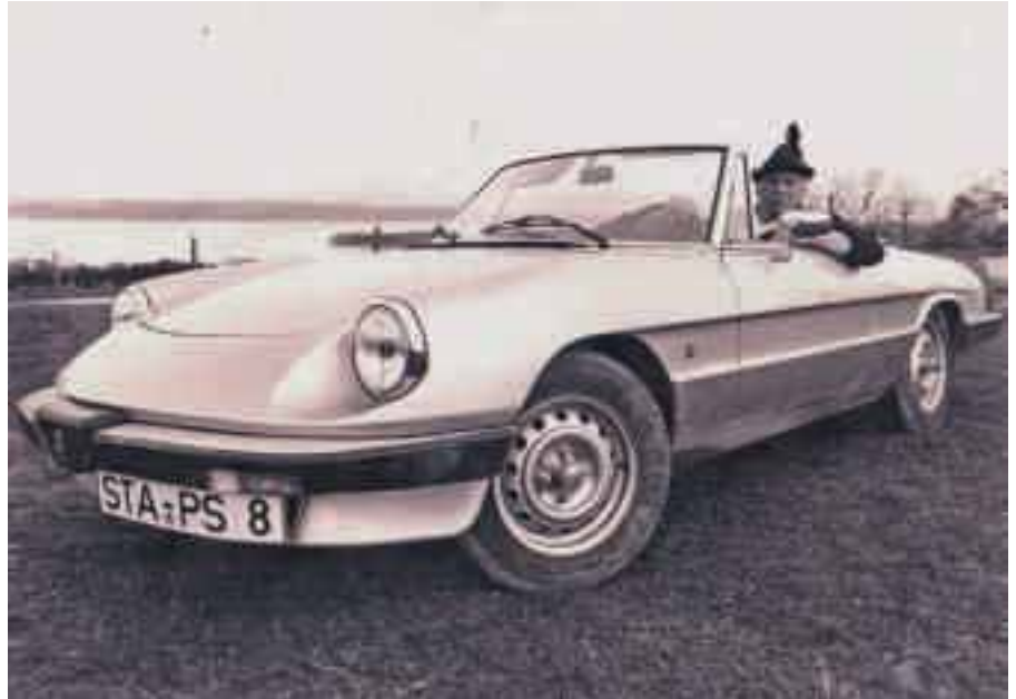
Schneidig und immer dabei: Der Pauli Sepp

Der Obergärtner ließ mit seinen Mitarbeitern und Grasweibern alles schön erblühen im Schlossgarten. Besondere Kunstwerke waren der große Schmetterling und die Initialen des Fürsten als großes Blumenbeet.