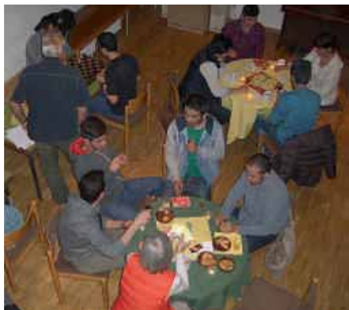
Tee trinken, Spiele machen und sich unterhalten im Friendship Teahouse

Das Kennenlernen ist dann ganz unproblematisch. In dem gemütlichen Saal im evangelischen Gemeindehaus sind bereits auf allen Tischen Gesellschaftsspiele verteilt und man kann nun entscheiden, wohin und zu wem man sich setzen möchte.