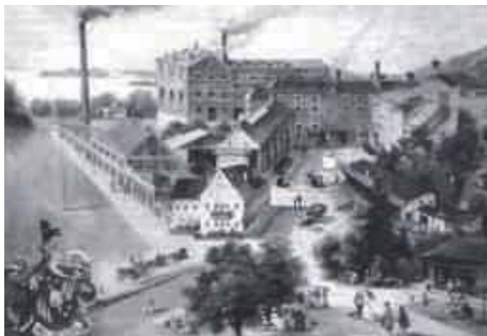
Vieregg'sche Schlossbrauerei Tutzing in der Gründerzeit

Um 1865 wurde für die Brauerei eine Quelle auf den Oberen Kellerwiesen gefasst, um 1900 kamen die Buchetquelle, die Erlenbergquelle, und die Gröberquelle dazu. Buchet- und Gröberquelle finden wir in Oberzeismering.