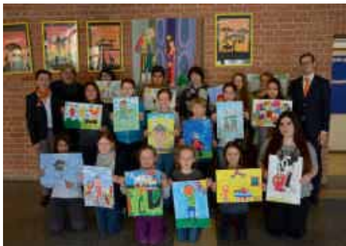
Sie freuen sich über ihren Erfolg: Die Gewinner des Malwettbewerbs der VR-Bank Starnberg-Herrsching-Landsberg.

Künstler und Helden: Sie griffen zum Pinsel oder Buntstift und brachten so richtig was aufs Papier. Mit viel Eifer beteiligten sich die Tutzinger Grund- und Mittelschüler am Malwettbewerb der VR-Bank Starnberg-Herrsching-Landsberg. Zu dem Thema „Fantastische Helden und echte Vorbilder“ ließen sich die Kinder und Jugendlichen viel einfallen. Mit