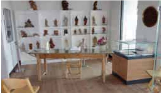
Heimatlich und vielfältig – das Ortsmuseum

Besonders reizvoll für eine Trauung im Tutzinger Ortsmuseum am Thomaplatz ist die Lage direkt am See und in unmittelbarer Nähe zur Alten Kirche Peter und Paul. Die Möglichkeit, nach dem Ja-Wort bei einem Stehempfang am Wasser