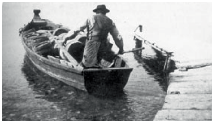
Biertransport: die Fässer auf dem Weg über den See

Der Biersteg zwischen Schloss und Dampfersteg erinnert daran, dass das Tutzinger Schlossbräu-Bier früher mit Schiffen über den ganzen See transportiert wurde.