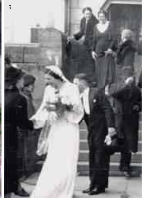
Der Bund fürs Leben: Hochzeitsbräuche und -bilder früher und heute