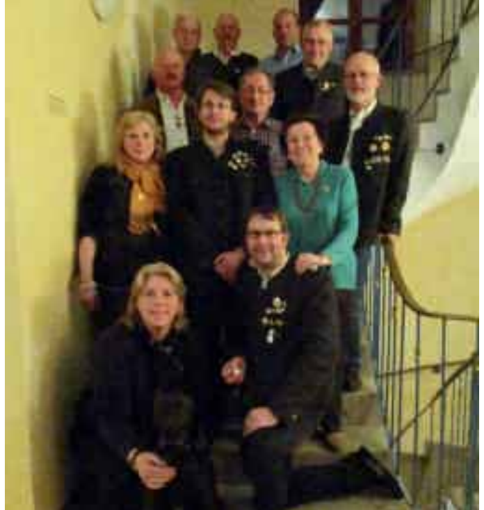
Tutzinger Altschützen - die Treppe der Sieger

Die Preisverteilung des Endschießens und der Saisonabschluss fanden am 24. März 2016 statt. 28 Schützen hatten sich am Endschießen beteiligt.