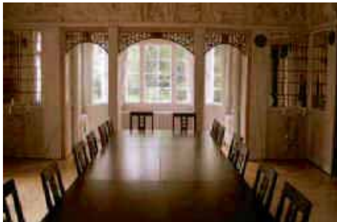
Fürstlich- der Spiegelsaal des Thurn und Taxis-Schloßes

Heiratswillige, die sich ihre Trauung in einer historischen Umgebung wünschen, haben die Möglichkeit, sich im Spiegelsaal im Schloss Garatshausen trauen zu lassen. Anmelden im