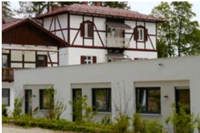
Rückzugsort für ein würdiges Leben bis zuletzt