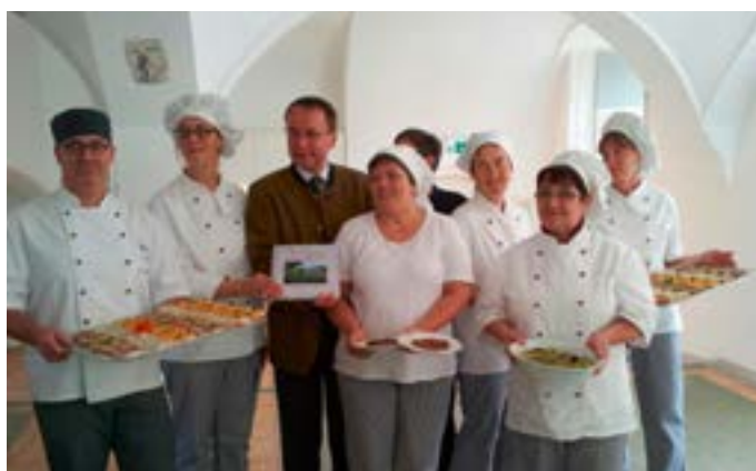
Die Küchenbrigade mit Akademiedirektor

Die Akademie bietet mir das Umfeld, in dem ich arbeiten mag. Ich liebe es zu kochen, für mich kommt es nicht in Frage, in einer Küche zu kochen, in der konventionelle Lebensmittel verarbeitet werden oder vorgefertigte Gerichte aufgekocht werden.