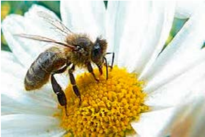
Naturprodukt Honig unter Regulierungsdruck

Die Herkunftsländer können, müssen aber nicht genannt werden. Diese Regelung erfordert aus Sicht der Verbraucherzentralen unbedingt mehr Klarheit.