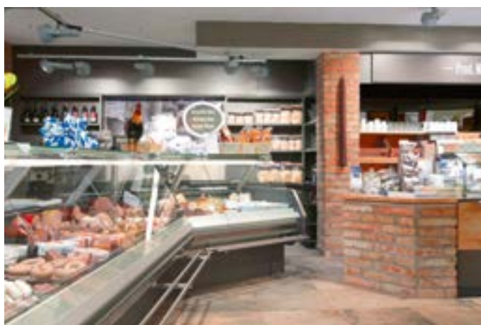
Appetitregend: Verkaufs- und Brotzeittheke in der Hallbergerallee

Lutz produziert selbst. Man lässt sich nicht die Wurst vom Brot nehmen, wenn es um den höchsten Ehrgeiz in Sachen Geschmack geht: Etwas mehr Petersilie in die Weißwurst? Den Räucherschinken doch noch ein paar Tage in der Kammer lassen? Hier sind Menschen mit Herz und Verstand am