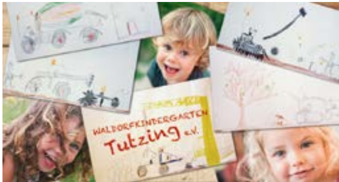
Pädagogik in neuen Räumen

Der Waldorfkindergarten bekommt nach 25 Jahren ein neues Zuhause! Die Gemeinde Tutzing lässt am bisherigen Standort (Traubinger Straße 67) ein neues Gebäude errichten und übernimmt auch dessen Grundausstattung. Hierfür sind wir der Gemeinde Tutzing sehr dankbar.