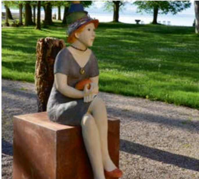
Plastiken von Hilde Würtheim im Park der Evangelischen Akademie

Besichtigungstermine der Ausstellung sind jeweils sonntags, 13.00 bis 17.00 Uhr, 6. September 2015 und 13. September 2015. Der Eintritt ist frei. An den genannten Besichtigungsterminen findet um 14.00 Uhr eine kostenlose Schlossführung statt.