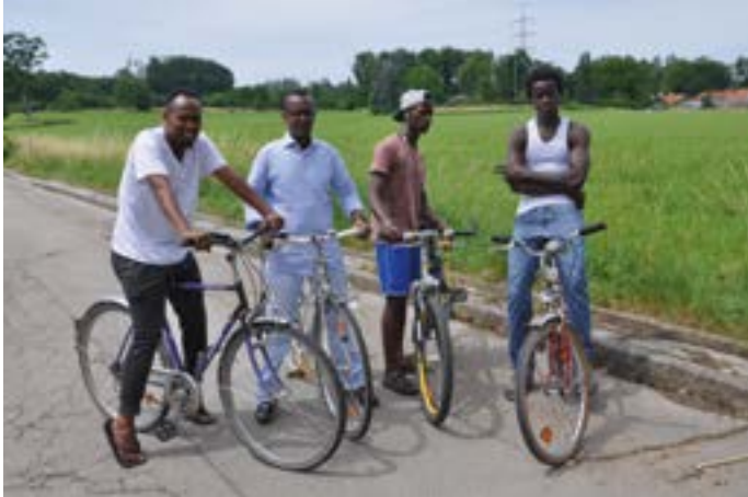
Auf der Suche nach Beheimatung

Die neuen Mitbürger in Traubing: Sie kommen aus dem Senegal, Eritrea, Somalia und der Ukraine. Der eine oder andere mag sie schon einmal gesehen haben im Bus, auf dem Rad oder beim Joggen. Sie sind hier vor ungefähr 3-6 Monaten angekommen mit nichts als der Hoffnung, bei uns eine