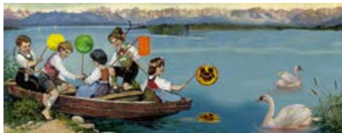
Aquarell des Tutzinger Grafikers Thomas Schöne

Schule, Hausaufgaben, daheim helfen, dann a bisserl spielen, meist am Turnplatz und dann? Waren wir zufrieden, freuten uns, wenn wir in die Gruppenstunde der Katholischen Jugend gehen durften. Mädchen extra, Buben natürlich zu einer anderen Zeit, eigene Gruppenleiter gestalteten die Stunden, die ausgefüllt waren mit Vorlesen, Singen und Ratschen, heute heißt das Diskutieren. Auf die Sommermonate haben wir uns besonders gefreut und zwar, weil wir Schifferl fahren durften. Damals war es noch beständiger, das Wetter – wenigstens mein ich das – und man brauchte nicht ewig lang vorplanen. Allerdings war's notwendig, beim Fischer Lidl oder beim Müller Ruderboote zu reservieren.