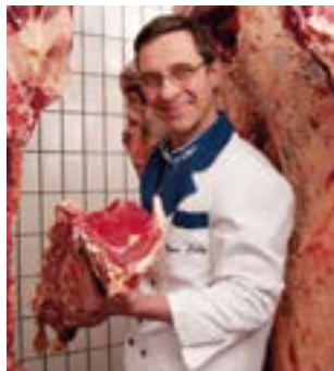
Bestes Fleisch aus nachhaltiger Aufzucht

Höchste Maßstäbe in Sachen Tierwohl von der Aufzucht bis zur Schlachtung bestimmen die Qualität des Fleisches bei Lutz.