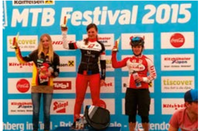
Der Lohn: Gruß von der Siegerbühne

„Eine recht flache Transferetappe stand heute auf dem Plan - eigentlich liegt mir dieses Profil mit kurzen Anstiegen gar nicht und so ging ich mit etwas Bauchschmerzen an den Start. Das Starterfeld wurde die ersten 15 Kilometer neutralisiert hinter dem Führungsfahrzeug auf einer Bergstraße bergab geführt, was sehr gefährlich war und viel Konzentration erforderte.“