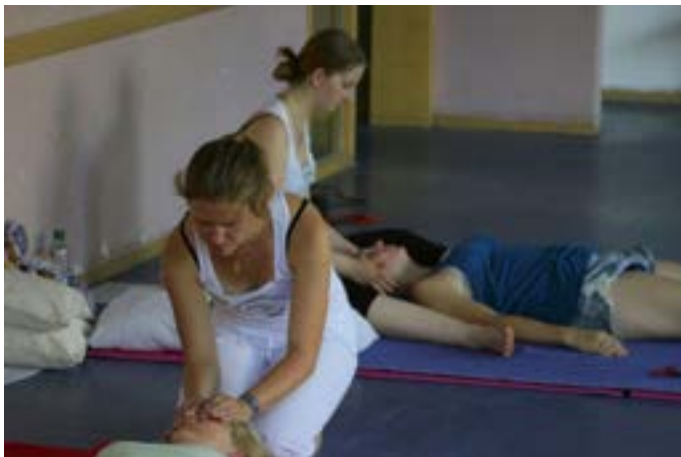
Die Energiebahnen des Körpers suchen und finden

Die Shiatsu Gruppe des Gymnasium Tutzings versammelte sich in der Aula, um die nötigen Vorbereitungen für den Shiatsu Abend zu treffen. Die Aula wurde für die Veranstaltung mit japanischen Lilien sowie künstlerischen Notizen und Plakaten zu den verschiedenen Massagetechniken geschmückt. Außerdem brachte jeder Schüler Finger-Food für ein Buffet mit, damit auch keiner hungern musste. Um 17:45 Uhr trafen dann die ersten Besucher ein, unter ihnen Freunde und Verwandte der Schüler, Ehemalige und sogar der Gründer des Europäischen Shiatsu Institutes in München, Klaus Metzner.