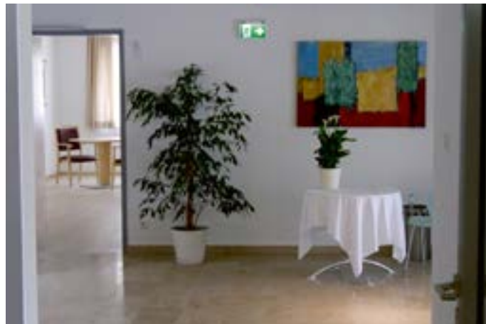
Ruhe im stilvollen, modernen Ambiente

Zwölf lichtdurchflutete Appartements bieten mit 30 bis 39 qm genügend Raum für den Gast und auch für einen zusätzlichen Angehörigen. Die Nasszellen sind rollstuhlgängig angelegt. Alle Zimmer verfügen über einen Ausgang auf Terrasse bzw. Balkon zum großen Parkgelände mit altem Baumbestand und Vogelgezwitscher. Beruhigende, schöne Bilder Tutzinger Künstler erhöhen die wohltuende Atmosphäre. Der nur zwei Gehminuten entfernte Bahnhof ermöglicht den Angehörigen eine Anteilnahme, die nicht noch durch lange Wege erschwert wird. Das Tutzinger Modell ist eine innovative Initiative, wohl ganz im Sinne des Bundesministers für Gesundheit, Hermann Gröhe, der gerade eine Gesetzes-