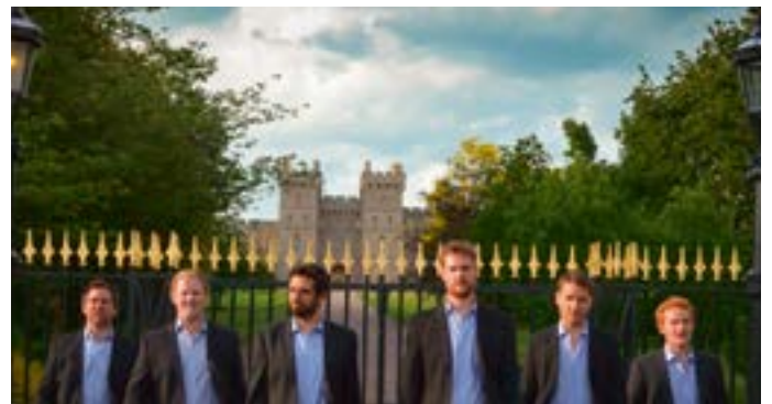
Das A-Cappella Ensemble vor Schloss Windsor

Man muss kein Mitglied der Royal Family sein, um „The Queen's Six“ zu hören: Das A-Cappella-Ensemble aus Windsor Castle gastiert im August in Deutschland. Der Eintritt zu den meisten Konzerten ist frei.