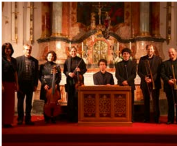
Klangpracht mit Liturgie

Auf dem Programm steht die rekonstruierte Fassung einer konzertanten Vesper des frühen 17. Jahrhunderts. In doppelchöriger Vokalbesetzung kommen geistliche Werke von Alessandro Grandi, Claudio Monteverdi und Michael Praetorius zur Aufführung. Der liturgische Ablauf wird außerdem durch mehrchörige Instrumentalcanzonen von Giovanni Gabrieli und Francesco Cavalli angereichert.