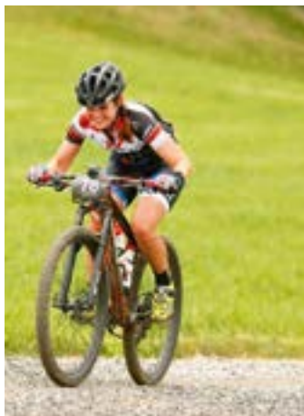
Challenge am Berg: Die letzten Kräfte mobilisieren

Die erste Etappe ging über 49 km und 2350 Höhenmeter (Hm). „Nachdem es den ganzen Vortag in Strömen geregnet hatte, riss der Himmel pünktlich zum Start auf. Erwartungsgemäß war das Teilnehmerfeld direkt nach dem Startschuss sehr nervös und hektisch. Ich fand schnell meinen Rhythmus. Der Trail war durch die Regenfälle oft sehr rutschig und ich fuhr vorsichtig, um keinen Sturz zu riskieren.