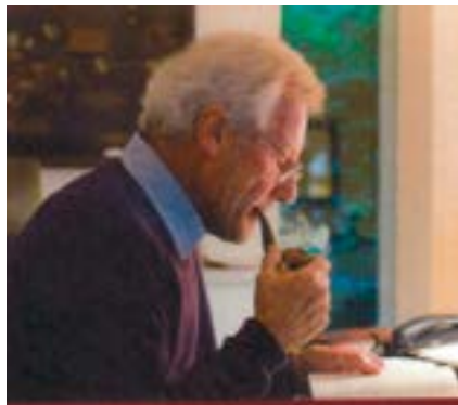
Autor Herbert Reich

Nun, wie gesagt, wenn uns gar zu langweilig war, ruderten wir von Garatshausen zum Badehaus der Benediktinerinnen – in der Hoffnung, sie beim Baden überraschen zu können.