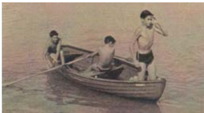
Auf der Suche nach „Seerosen“

Sichtschutzbretts durchtauchen zu können, denn das Badehaus hatte über und unter Wasser Bretter, die mit ca. 20 cm „Luft“ dazwischen den „Indoorpool“ der Schwestern bildete und nur die untersten Bretter waren so weit vom Seegrund entfernt angenagelt, dass man drunter durchtauchen konnte. Das also taten wir, um dann zwischen den eigentlich nur wassertretenden Klosterschwestern, die kahlköpfig und mit