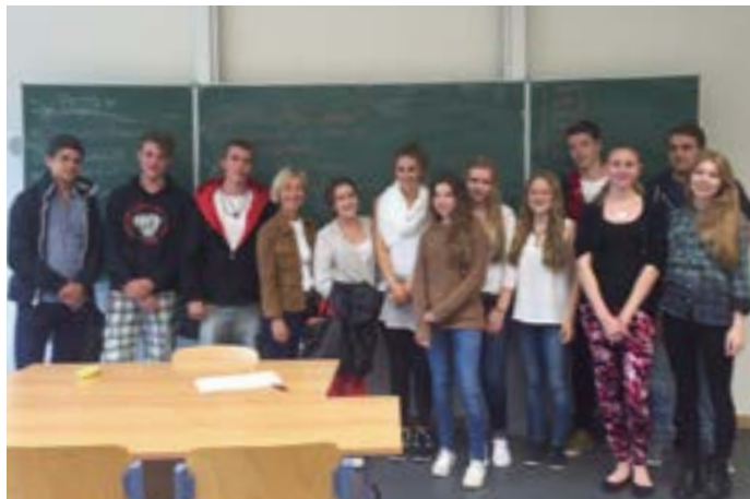
Zeitgeschichtlicher Schülerwettbewerb: Tutzinger Gymnasiasten vorn