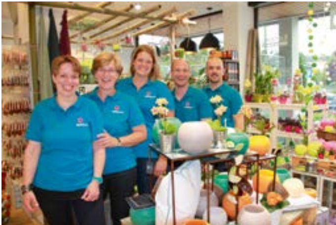
Die ganze Pracht der Floristik - seit 5 Jahren

Mit der Vergrößerung der Verkaufsräume ist auch das Personal angewachsen. Fünf Personen betreuen jetzt sowohl den Verkauf wie auch die Floristik.