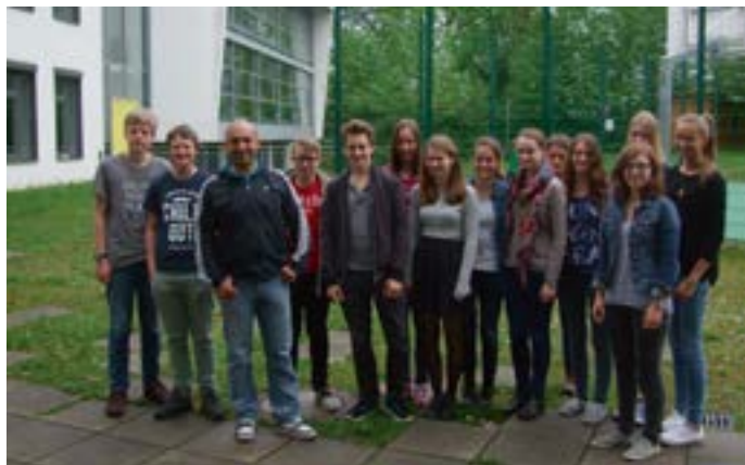
Der Kabarettist und sein Publikum: Politik mit Spitzen und Lachpointen

Um auch den Teilnehmern am Studium Generale, die Django Asül bis zu diesem Zeitpunkt noch nicht kannten, einen Einblick in seine Tätigkeit zu geben, wurde zunächst ein kurzes Video von einem seiner Auftritte gezeigt. In der anschlie-