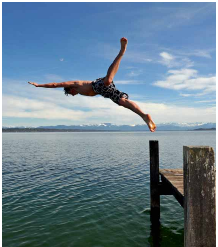
Lustvoller Sprung ins kühle Nass

Herzlichst Ihre Familie Lütjohann und das Seeblick-Team