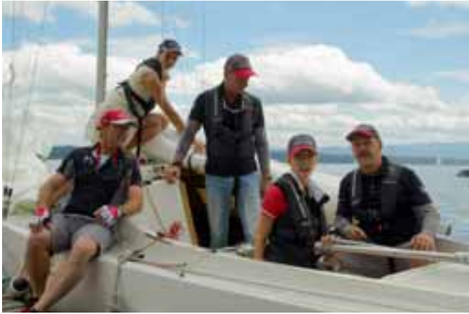
Üben für die Charity Regatta im Saronischen Golf