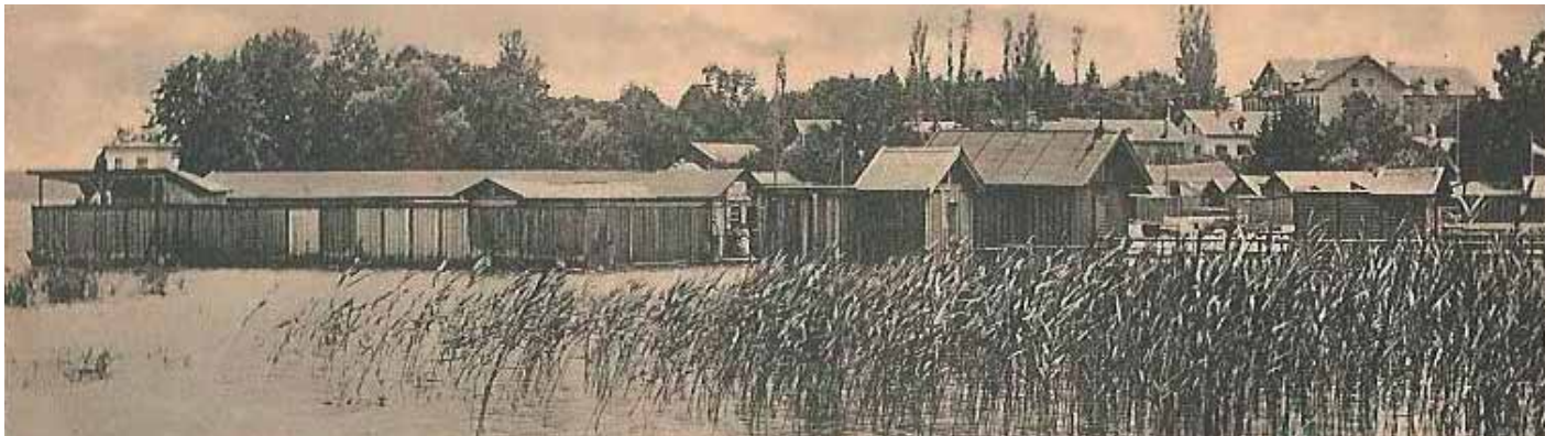
Dauerthema im Verschönerungsverein: Die Badehütten

8.10.1928: Neues Titelbild für den Ortsprospekt. Südbad-Seepromenade- Weg nach Unterzeismering.