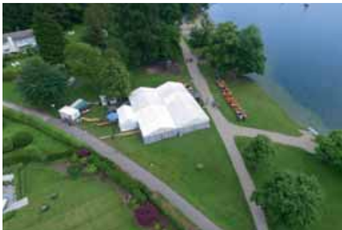
Gelungenes Mehrgenerationenfest drinnen und draußen

Einige Tutzinger ließen sich von dem schlechten Wetter nicht abhalten und kamen an den See. Es lohnte sich: Bei Kaffee und Kuchen riss gegen 16 Uhr die graue Wolkendecke auf und die Sonne kam raus. Sofort füllten sich die Biertische. Die JMler waren gut vorbereitet und bauten schnell einige