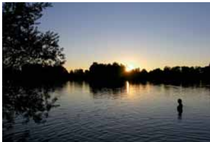
Nach dem Ansturm: Letzte Sonnenstrahlen

Hinter dem Unmut vieler -nicht nur- Tutzinger steckt aber ein ganz anderes Problem: die zunehmende Rücksichtslosigkeit und Egozentrik vieler „Gäste“ am See, die sich leider gar nicht wie Gäste benehmen. Dass die Schilder „Lagern und Baden verboten“ sowieso ignoriert worden sind hat zu ihrer Demontage geführt. Aber muss man sich wirklich in