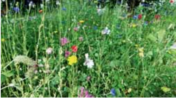
Die neuen Verkehrsinseln in Blütenpracht