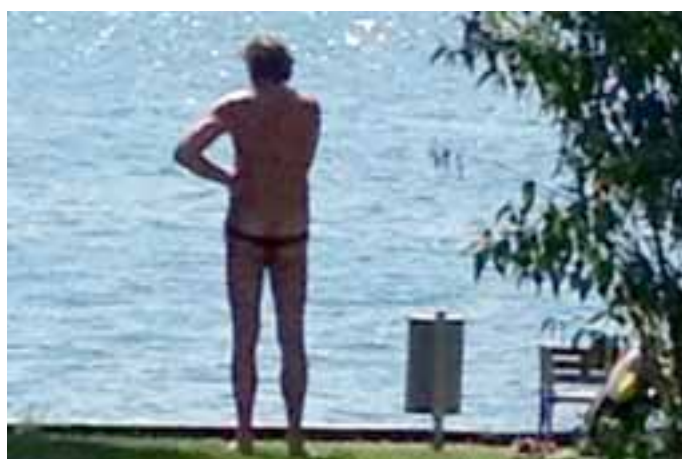
Badegast mit Einblick