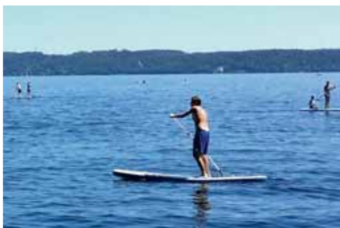
Seewandern mit Traumblick