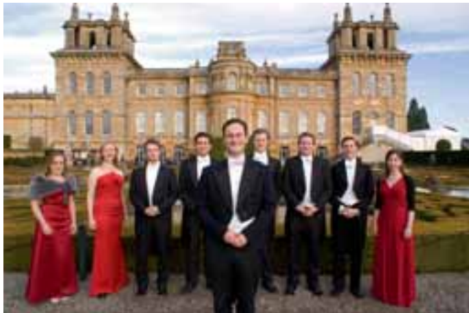
Ein Hauch von Oxford - die Blenheim Singers als Botschafter

Konzertgenuss der Extraklasse erwartet alle Musikfreunde am 13. September 2016 in Tutzing. Das international bekannte Ensemble der Blenheim Singers gastiert im Rahmen seiner Konzertreise in Deutschland und gibt am 13. September, 19.30 Uhr, in St. Joseph, Tutzing, Kostproben seines herausragenden Könnens. Und eine wahrhaft noble Geste – der Eintritt zum Konzert ist gegen einen freiwilligen Beitrag für den Chor. Der renommierte englische Chor der Blenheim Singers wurde 2006