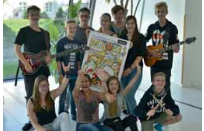
Gewonnen! Erster Platz für die Schulband der Realschule