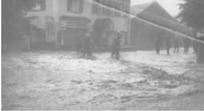
Hochwasser an der Tutzinger Hauptstraße 1932

Zu: Alle Wetter, unser Klima TN 05 / 2016 Postkarten in meiner Sammlung dokumentieren: Hochwasser ist auch bei uns möglich. Gernot Abendt