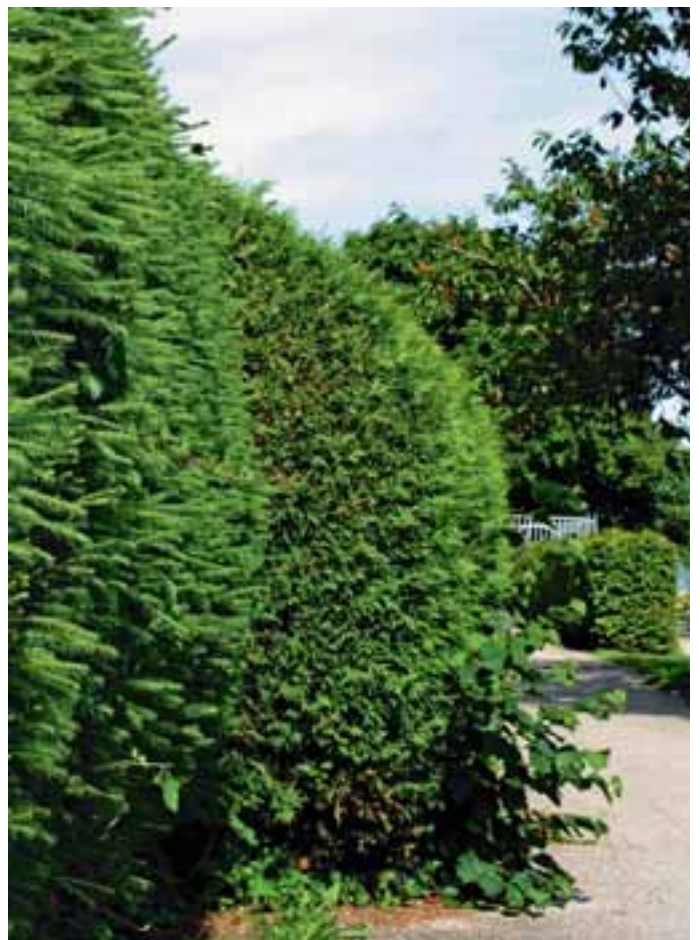
Fußgänger, Autofahrer und Radler aufgepasst - hier ist's unübersichtlich