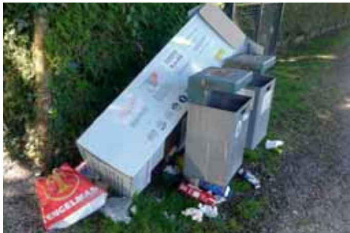
Übervolle Mülltonnen nach einem sonnigen Tag am See. Hausmüll gesellt sich dazu.

Über die Wochen schlechten Wetters blieben die Anlagen an der Brahmospromenade, am Thomaplatz und im Bleicherpark dank fehlenden Besucheransturms überwiegend, recht sauber.