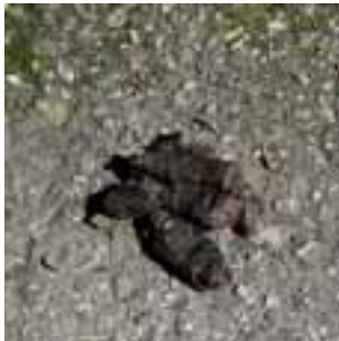
Abschreckendes auf Weg und Promenade

Ein Spaziergang durch die Tutzinger Parkanlagen gleicht oft einem Hindernislauf – ein Hundehaufen hier, ein Hundehaufen dort – und das, obwohl in regelmäßigen Abständen ein Spender steht, der gerne Plastiktüten verteilen würde, in denen man das duftende Geschäft entsorgen könnte – aber die