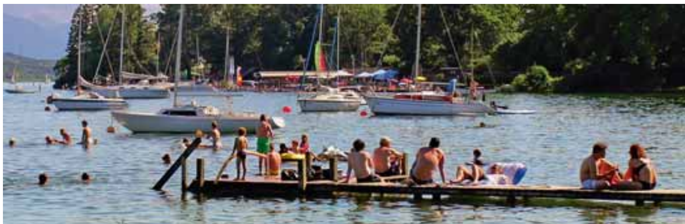
Steg der Sommerwonnen: Baden, Sonnen, Wassersport

So viel zu den Schattenseiten der Hochsaison.