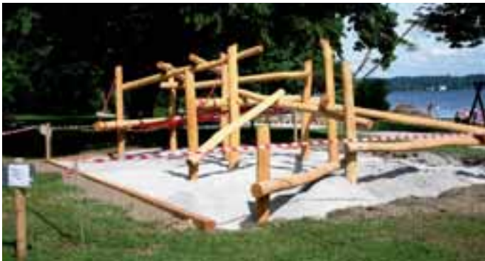
Neue Spielgeräte an der Seepromenade

Eine Baustelle an der Brahmospromenade hatte viele Spaziergänger überrascht. Auf Nachfrage während der Gemeinderatsitzung wurde mitgeteilt, dass die Gemeinde durch Mitarbeiter des Bauhofs lediglich Maßnahmen zum Unterhalt des Spielplatzes durchführt.