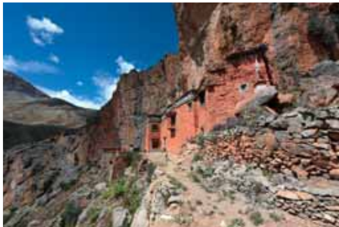
Land der Yaks, Blauschafe und Schneeleoparden